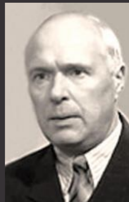
МОДЕСТ ШЕПИЛЕВСКИЙ (1906–1982)

Торжественный и величавый, ДОМ SHEPILEVSKIY академичен и выверен, аккуратно вписан в существующий архитектурный контекст, занимающий не доминирующую, а скорее лидирующую позицию.